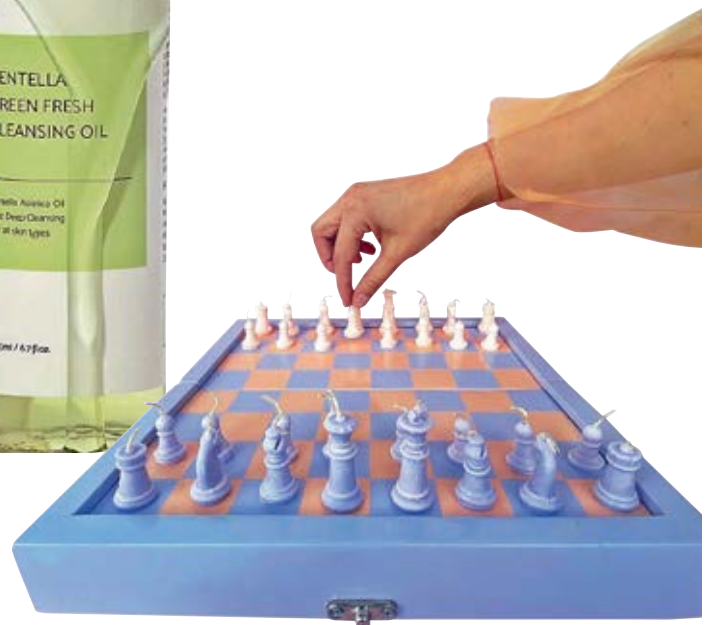
Check Mate THE M PROJECT $ 60

Vela en tono claro y en forma de perrito con detalles y texturas realistas para adornar tu hogar