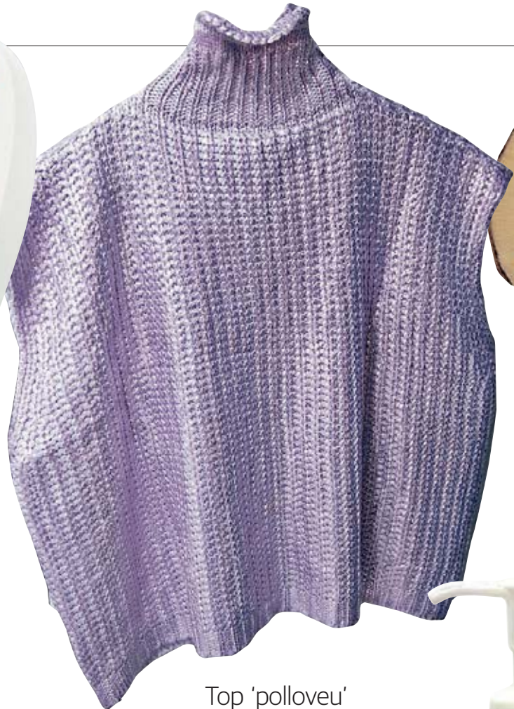
Top 'polloveu' CORAZÓN DE MELÓN $ 48 Este top pulóver con cuello de tortuga es una prenda fresca y versátil para una salida en la tarde.