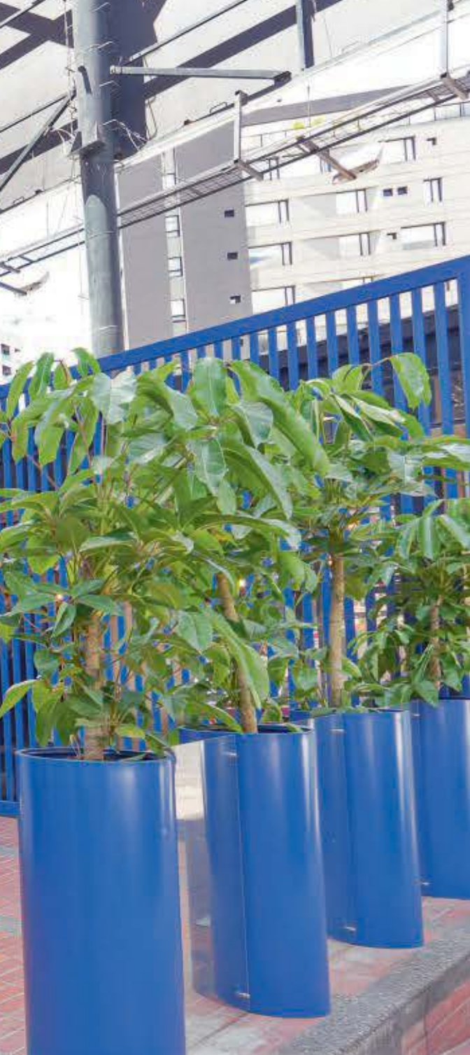
Cada rincón del Amex Shop Small Pop-Up fue diseñado para ser sentido, recordado y recomendado.