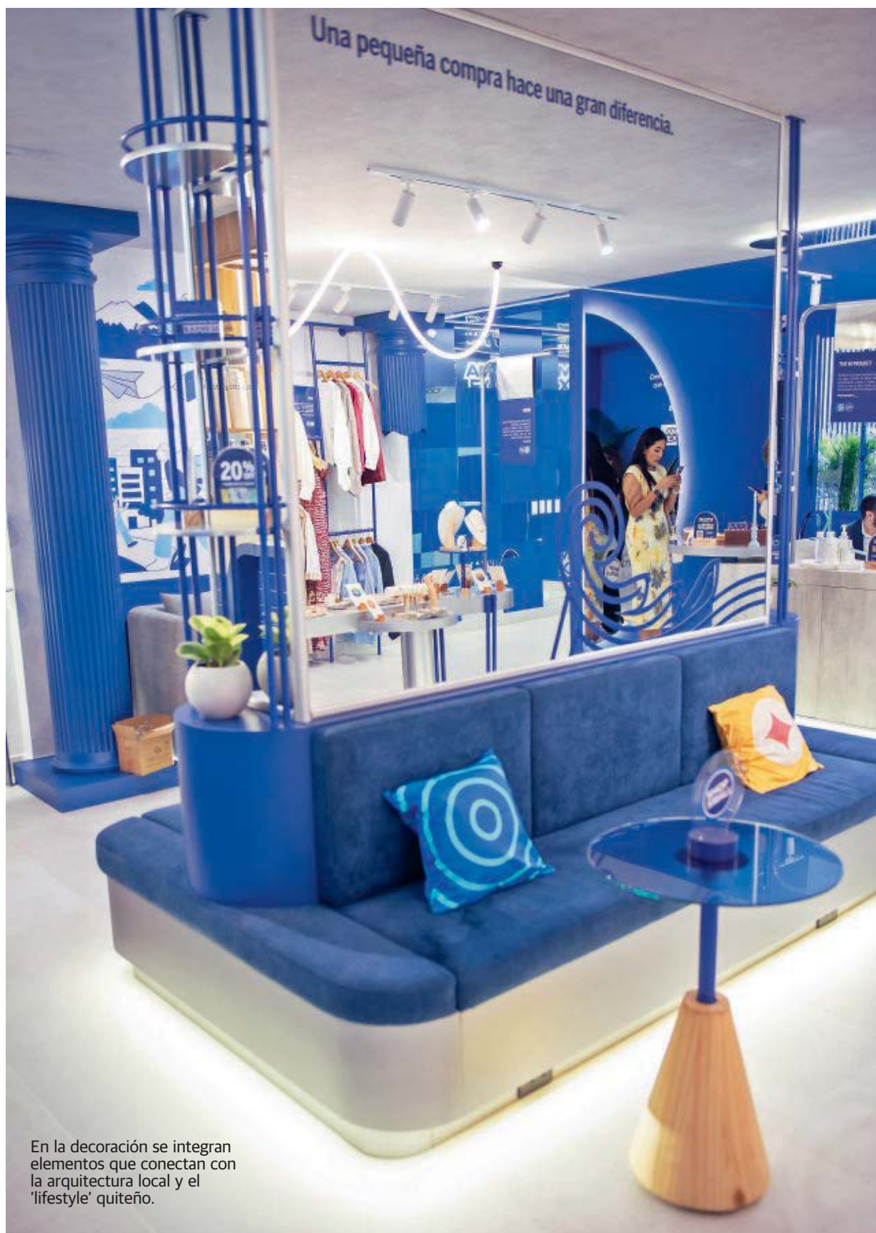
En la decoración se integran elementos que conectan con la arquitectura local y el 'lifestyle' quiteño.