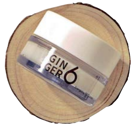
Energizing Pepti Cream de Ginger 6 KYELA KOREAN SKINCARE $ 36,90 (precio normal) $ 29,52 (precio Amex) Crema de jengibre para rostro con efecto energizante