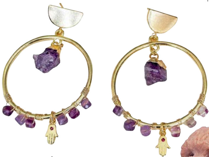
Aretes NURA $ 35

Argollas con baño de oro y piedras naturales, elaboradas y diseñadas a mano para dar un toque único al outfit