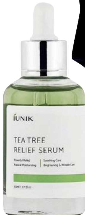
Tea Tree Relief Serum