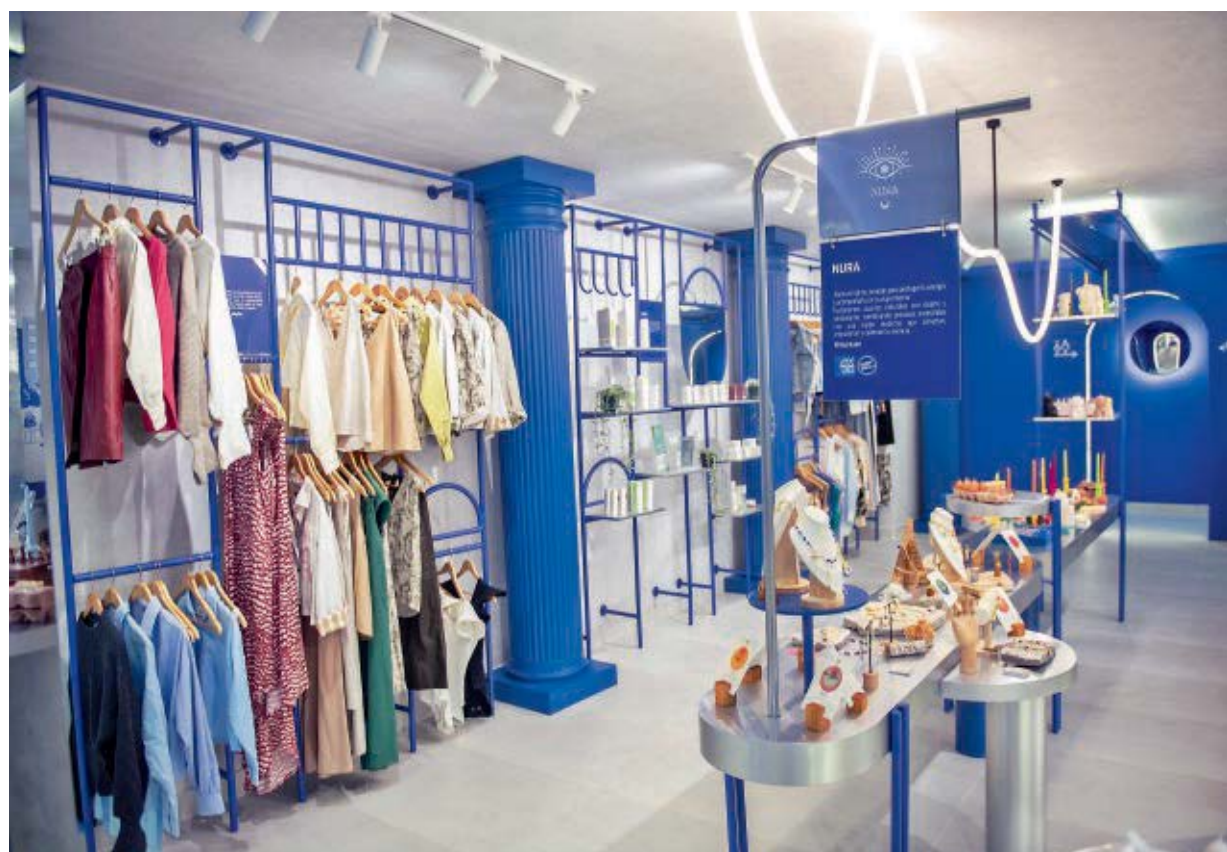
Materiales como la madera clara, los espacios monocromáticos, el vinil metalizado y las estructuras metálicas en color azul generan contraste y calidez en el Amex Shop Small Pop-Up.