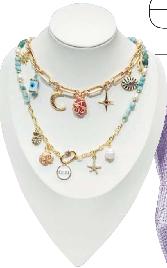
Chunky Charms NURA $ 55 Collar corto