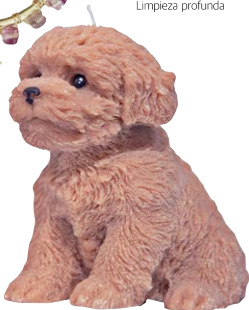
Vela de perrito THE M PROJECT $ 25

Vela en tono claro y en forma de perrito con detalles y texturas realistas para adornar tu hogar