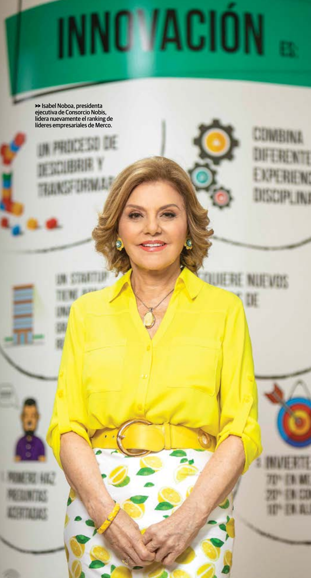
» Isabel Noboa, presidenta ejecutiva de Consorcio Nobis, lidera nuevamente el ranking de líderes empresariales de Merco.

ISABEL NOBOA , PRESIDENTA EJECUTIVA DE CONSORCIO NOBIS, SE MANTIENE A LA CABEZA DEL RANKING DE LÍDERES EMPRESARIALES DE MERCO. LA EMPRESARIA GUAYAQUILEÑA ES UN REFERENTE DEL LIDERAZGO FEMENINO EN ECUADOR Y DE INSPIRACIÓN PARA OTRAS MUJERES QUE TRABAJAN POR ALCANZAR LA CIMA EN EL MUNDO DE LOS NEGOCIOS.