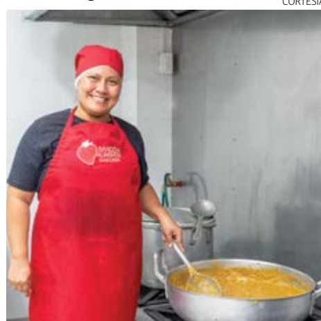
» La empresa participa en programas como “Kilos de Amor”, en colaboración con el Banco de Alimentos Diakonía.

La empresa apunta que continuará impulsando este año en prácticas sostenibles en el sector como parte de su modelo de negocio.