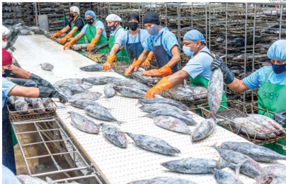
» Las operaciones de Nirsa abarcan desde el proceso de pesca y extracción de las especies hasta su comercialización.

Entre las prácticas de sostenibilidad de Nirsa también se encuentran iniciativas enfocadas en el bienestar de las comunidades. La empresa participa en programas como “Kilos de Amor”, en